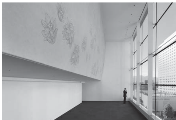
北海道建築賞受賞作品「六花亭札幌本店」の設計 河合 有人 君(株式会社 竹中工務店北海道支店)